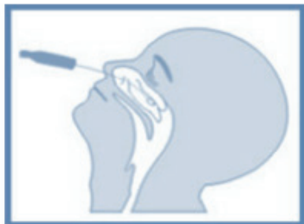
A – Swab nasal.