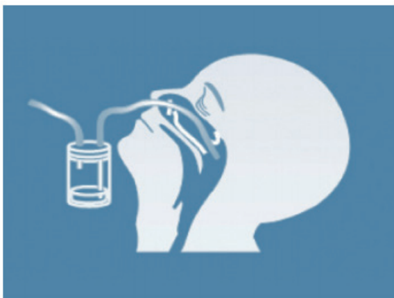
Figura 1. Ilustração da técnica para a coleta de aspirado nasofaríngeo.

As amostras devem ser mantidas refrigeradas (4-8°C) e devem ser processadas dentro de 24 a 72 horas da coleta até chegar ao LACEN ou ao laboratório privado. Após esse período, recomenda-se congelar as amostras a -70°C até o envio ao laboratório, assegurando a manutenção da temperatura.