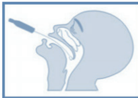
B – Swab oral.